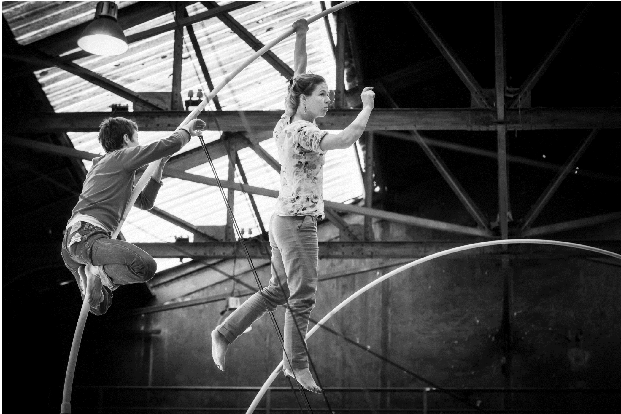
© Bruno Maurey – La Spire, Résidence à l'Atelier 231, Sotteville-lès-