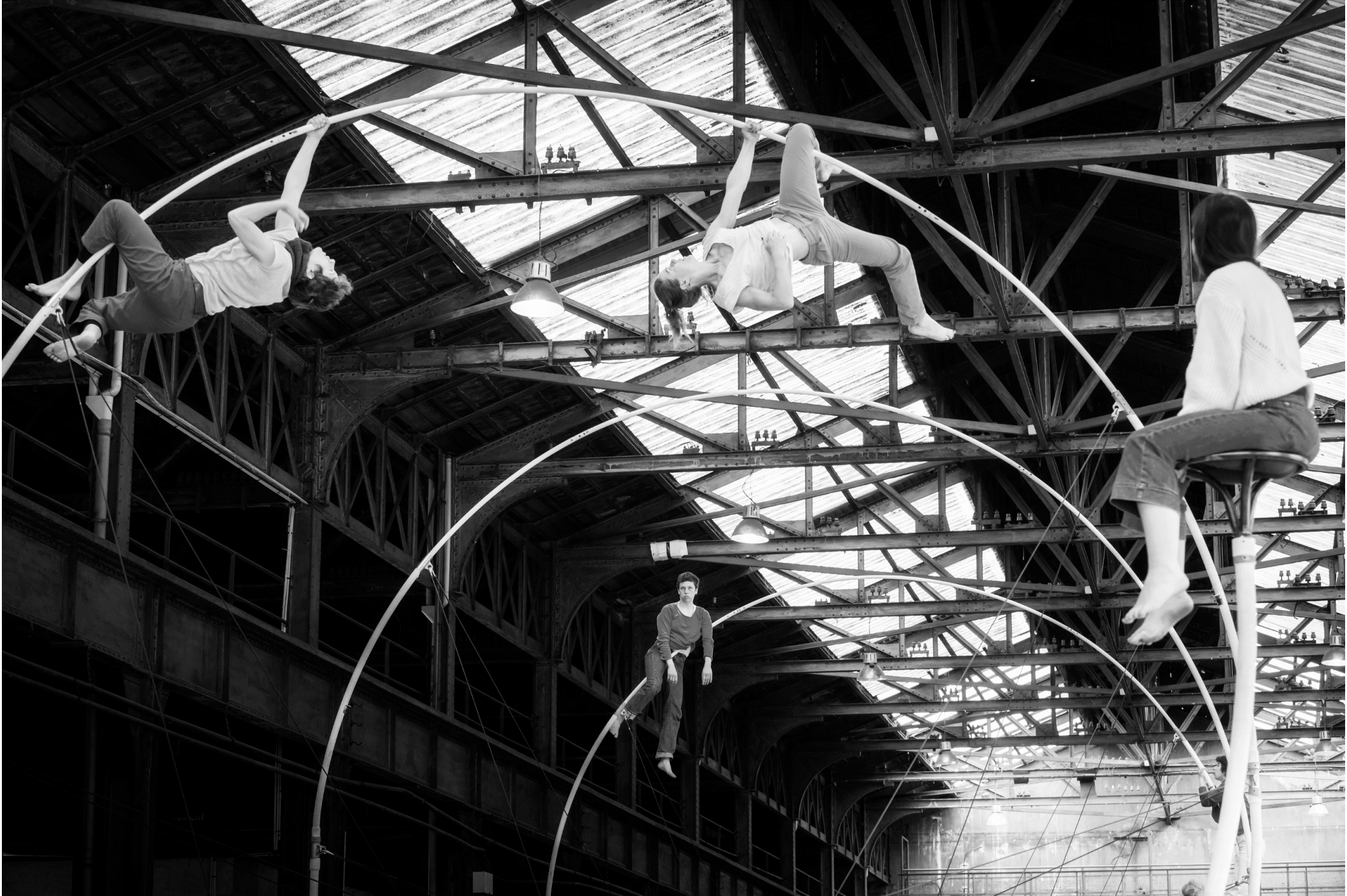
© Bruno Maurey – La Spire, Résidence à l'Atelier 231, Sotteville-lès-Rouen