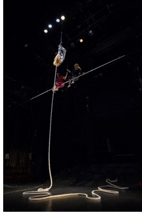
© Alexandre Kozel – Ose, Lannion (22)