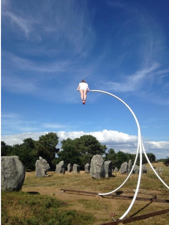
© Netty Radvanyi – Horizon, Tournage ARTE, Carnac (56)