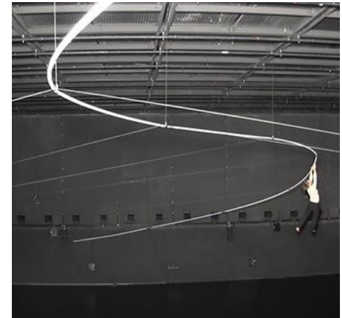
© Éric Blossé – la ligne Aléas, 2014, Angers (49)