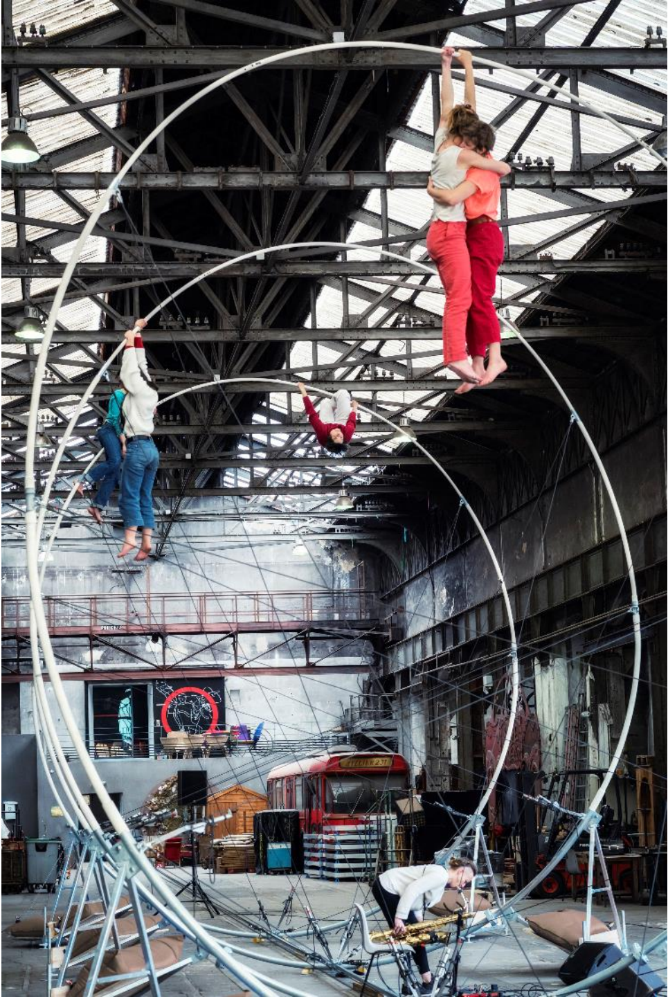
© Bruno Maurey – La Spire, Résidence à l'Atelier 231, Sotteville-lès-Rouen