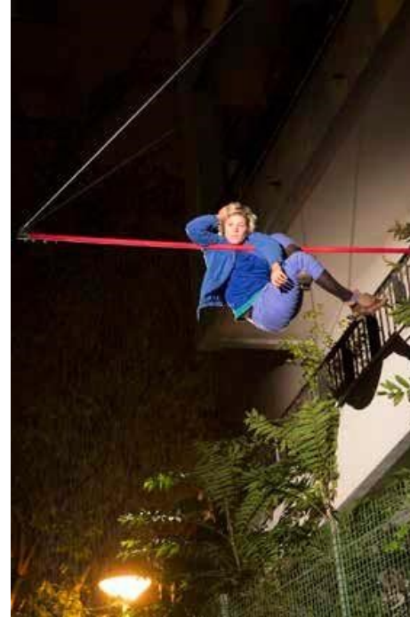
Absences – Nuit blanche, 2014, Paris (75)