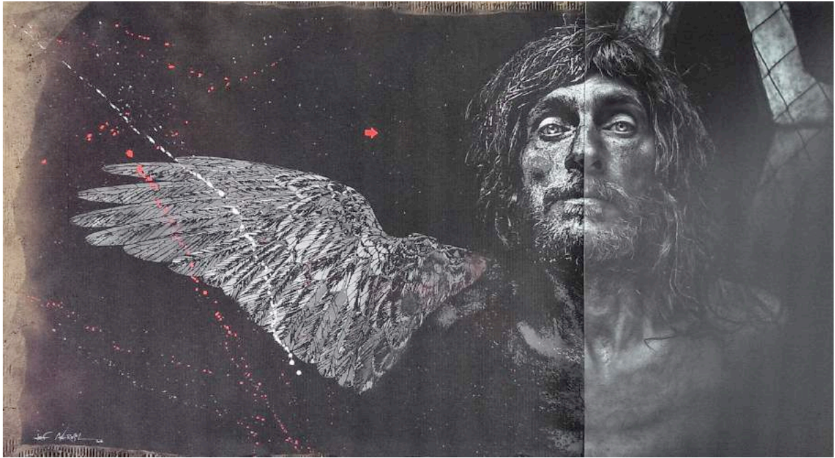
Photographie de Lee Jeffries/ J. Aerosol

Terres Brulées Ils marchent Sans regarder Ils marchent À l'envers