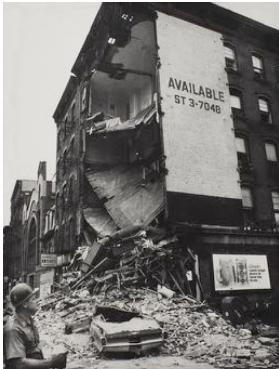
© Gordon Matta Clark – Untitled (Anarchitecture)

Dans une recherche qui mêle sans cesse le réalisme à l'étrange, l'invention acrobatique aux envolées chorégraphiques, il s'agit de faire apparaître des lignes de faille qui façonneront cet univers.