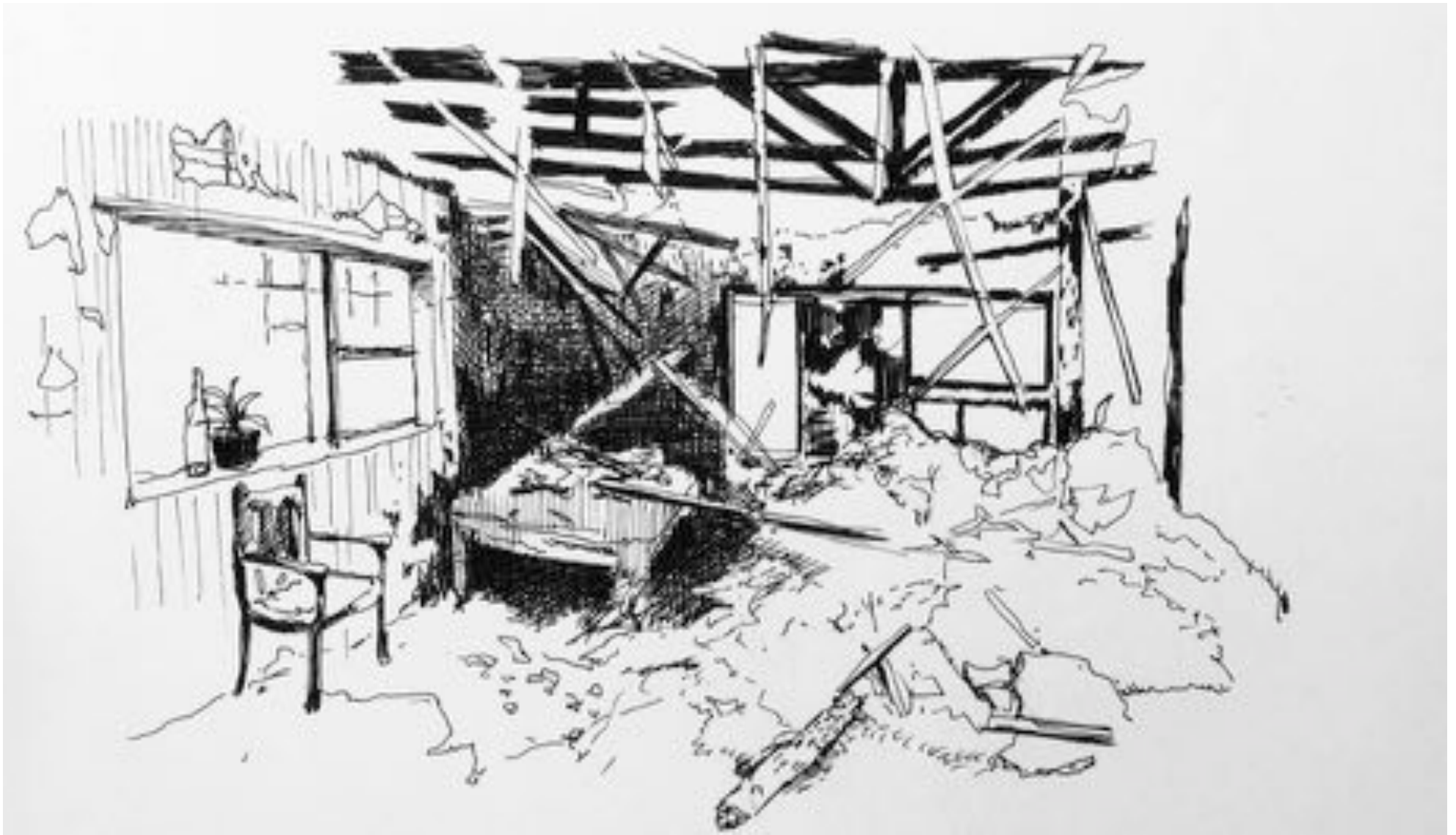
© Gabriel Tondreau - croquis préparatoire