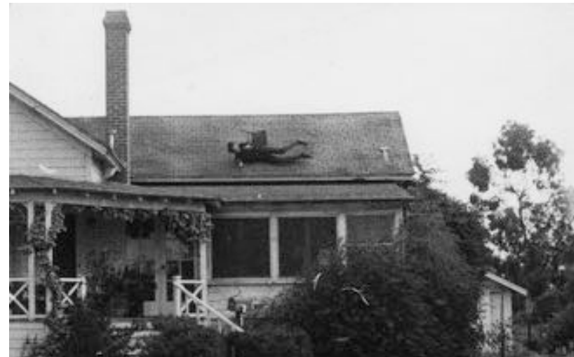
© Bas Jan Ader, Fall 1