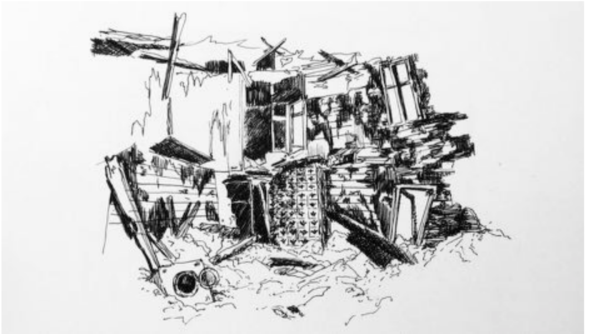
© Gabriel Tondreau - croquis préparatoire